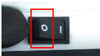
片切スイッチの表示【○】側