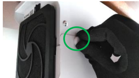
手で回して取付けて下さい