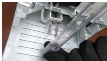
UVCランプクリップ取外し状態

※ご注意：UVCランプの中央を持つと故障や破損の恐れがありますのでランプの先端部分（灰色部分）を持ち固定クリップに取付けて下さい。