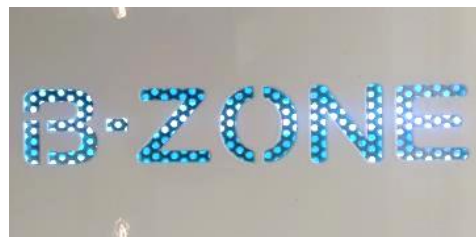
UVCランプ点灯状態（拡大写真）