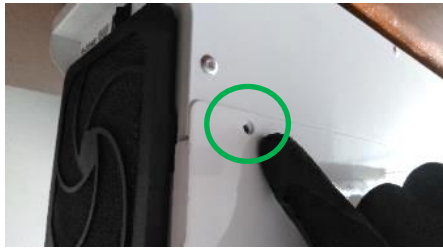
化粧ネジ取付け箇所（穴の位置を揃える）