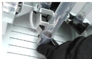
UVCランプの先端部分 （灰色部分）を持ち取外し