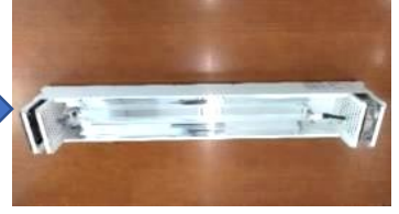
上蓋（カバー）取外し後