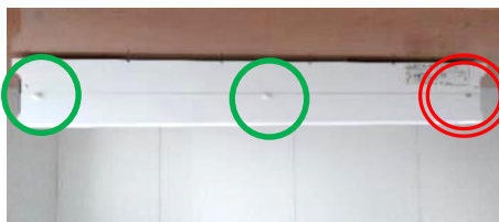
反対側にも同様に化粧ネジ（六角穴付ボルト）取付け穴があります