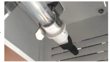
UVCランプクリップ取付け後