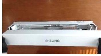
上蓋（カバー）を取外し中