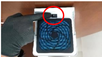
片切スイッチ箇所