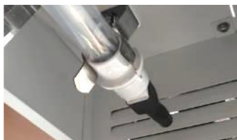
UVCランプクリップ取付け状態

※ご注意：UVCランプの中央を持つと故障や破損の恐れがありますのでランプのコネクター部分（白色部分）を持ち固定クリップから取外して下さい。