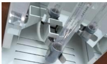
UVCランプクリップ取付け状態

※ご注意：UVCランプの中央を持つと故障や破損の恐れがありますのでランプの先端部分（灰色部分）を持ち固定クリップから取外して下さい。