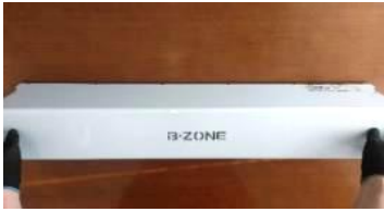
上蓋（カバー）を両手で持つ