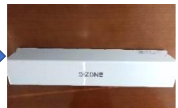
上蓋（カバー）取付け後