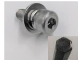
○：六角穴付ボルトの場合 *六角レンチ3mmにて取付けて下さい