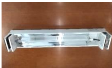
上蓋（カバー）取付け前