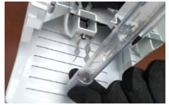
UVCランプクリップ取外し後