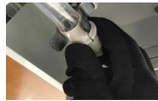
UVCランプのコネクター部分 （白色部分）を持ち取外し