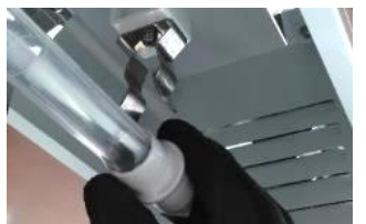
UVCランプクリップ取外し後