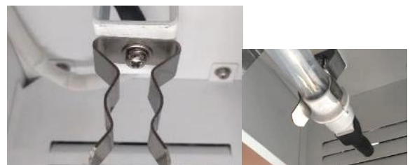
固定クリップランプコネクター側