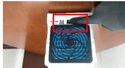
片切スイッチの表示【 | 】側を押して下さい