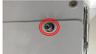
六角穴付ボルト取付け後

*化粧ネジや六角穴付ボルトの取付けができない場合はプライヤー又はペンチを用いて下さい。