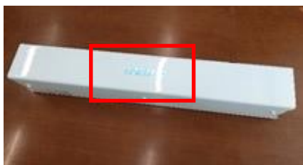
B-ZONEロゴ（UVCランプ点灯写真）