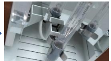
UVCランプクリップ取付け後