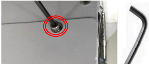
六角穴付ボルトは六角レンチ3mmにて取付けて下さい