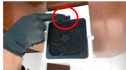
片切スイッチの表示【○】側を押して下さい