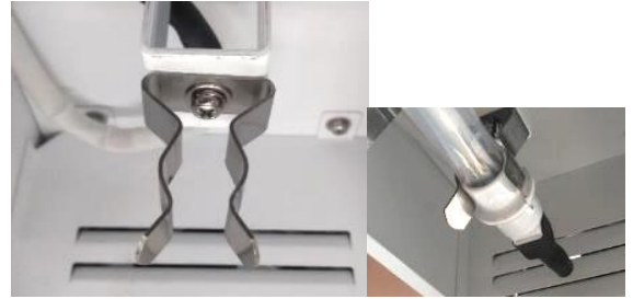
固定クリップランプコネクター側