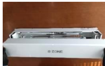
上蓋（カバー）取付け中