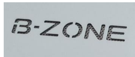
UVCランプ消灯状態 (拡大写真)