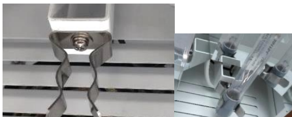
固定クリップランプ先端側

※ご注意：固定クリップはUVCランプ先端側とUVCランプコネクター側にあります。