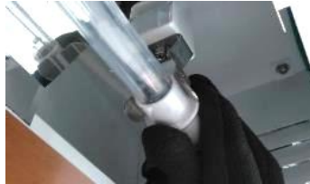
UVCランプのコネクター部分（白色部分）を持ち取付け