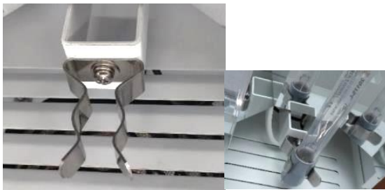
固定クリップランプ先端側

※ご注意：固定クリップはUVCランプ先端側とUVCランプコネクター側にあります。