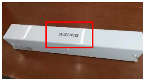
B-ZONEロゴ (UVCランプ消灯写真)