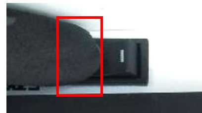
片切スイッチの表示【○】側を押して下さい