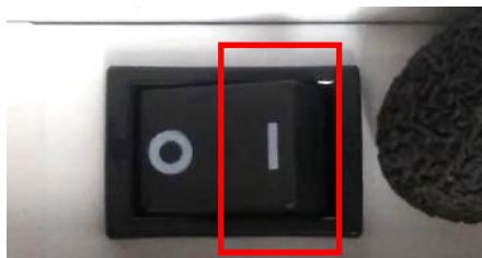
片切スイッチの表示【 | 】側