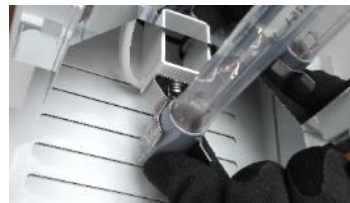
UVCのランプ先端部分（灰色部分）を持ち取付け